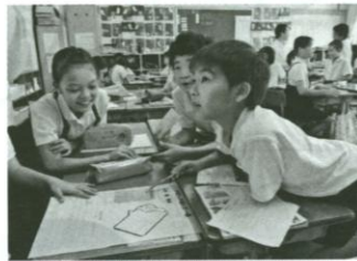
新聞を活用した授業に取り組み沖縄市立コザ小学校の4年生 2013年11月